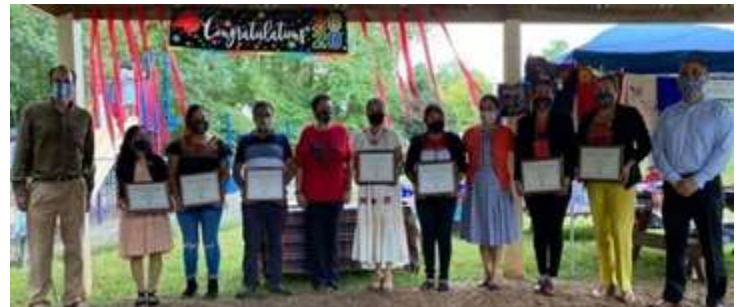
Graduación del Curso de Liderazgo

Desarrollo de liderazgo latino: Por segundo año, organizamos en conjunto con el Centro de Inmigrantes del Sagrado Corazón en Richmond un programa de estudio de dos semestres y 80 horas en Cívica y Desarrollo de Liderazgo para siete hispanos. La Universidad de Richmond otorgó un Certificado de Logro al completar con éxito los estudios a estos siete participantes del curso.