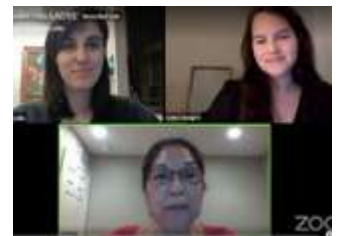
Videos en Facebook

Como una evolución natural de nuestro alcance comunitario, y respondiendo a la necesidad de desarrollar eventos que no fueran restringidos por Covid, a mediados de marzo Sin Barreras fortaleció su presencia en su página de Facebook, con videos sobre temas de interés para la comunidad. La respuesta ha superado nuestras expectativas más altas -- ¡más de 25.000 visitas en nueve meses! Publicamos veintiún vídeos con un promedio de veintiséis minutos con 18,9811 espectadores, más de 900 espectadores por sesión. Cuatro de ellos atrajeron una amplia audiencia: una presentación de nueve minutos sobre la Orden Ejecutiva del Gobernador sobre las restricciones de Covid; dos presentaciones sobre Licencias de Conducir y Tarjetas de Privilegio de Conducir, cuarenta y setenta minutos respectivamente; y un resumen de fin de año de media hora. También publicamos una “cartelera” de tres minutos con información sobre la licencia de conducir, ¡vista por 6.500 personas! Sin Barreras se ha descubierto una manera espectacularmente exitosa de mantener informada a nuestra comunidad a pesar de Covid-19. Véase más en: