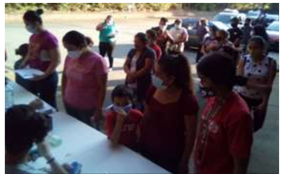
Renta y Alimentación para 900 Familias

Podría decirse que nuestro mayor éxito este año ha sido la decisión de la Junta de abordar la crisis de Covid 19 al embarcarse en un programa de subvenciones individuales para familias que enfrentan la crisis económica, un nuevo papel para Sin Barreras. Estamos agradecidos de haber atraído fondos adicionales sustanciales para hacerlo. Colaboramos con un grupo local, Cville Community Cares, para distribuir $56,850 en cupones de alimentos a 367 familias. Canalizamos el apoyo de alimentos y alquiler de $20,000 de la Community Foundation of the Blue Ridge a 67 familias, y de la Fundación Hispanics in Philanthropy de California de una subvención de $15,000 a 47 familias. De la ciudad de Charlottesville ganamos $149,000 para apoyo de alquiler para 298 familias y ganamos dos subvenciones competitivas de $50,000 del condado de Albemarle con el mismo propósito para 110 familias. Total: 889 familias hasta la fecha, mientras seguimos buscando otros donantes interesados. Estas actividades se llevaron a cabo casi sin cobro administrativo para los donantes, cuyo costo fue apoyado por cientos de donaciones locales. ¡Estamos enormemente agradecidos por este apoyo financiero que nos permitió entregar estas subvenciones!