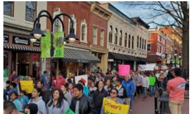
Manifestación para Licencias

Manifestación Para las Licencias de Conducir: Sin Barreras fue el promotor clave de una manifestación de 400 personas que pasó junto a la oficina del senador Creigh Deeds en apoyo de la campaña Licencia de conducir para todos antes de su exitosa votación en la legislatura de Virginia esa semana.